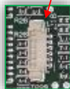
Aggiunto un connettore