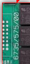
Posizione codice pre - modifica